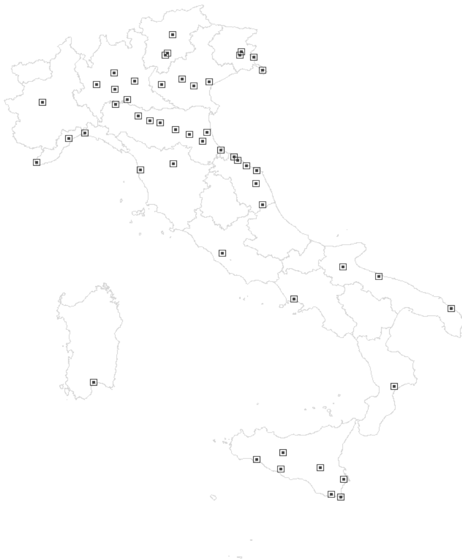
Figura 2 - MSNA in prima accoglienza nel 2008: una mappa dell'Italia. I 51 Comuni che hanno accolto l'85% dei MSNA in prima accoglienza nel 2008