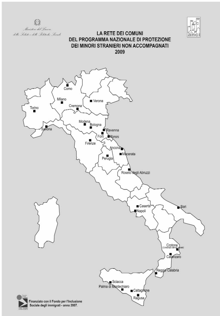
Figura n. 4 – La rete dei Comuni del Programma nazionale di protezione dei minori stranieri non accompagnati nel 2009