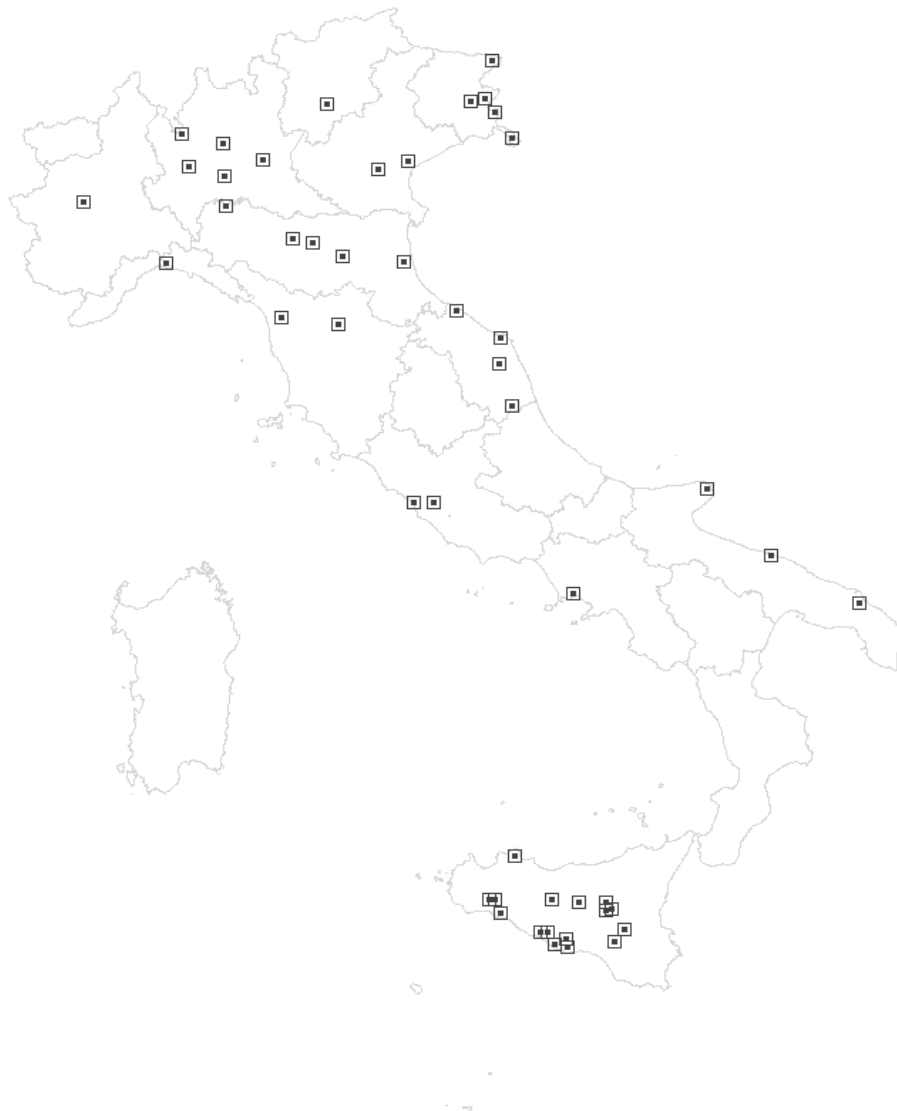
Figura n. 3 - MSNA in seconda accoglienza nel 2008: una mappa dell'Italia. I 46 Comuni che hanno accolto l'85% dei MSNA in seconda accoglienza nel 2008