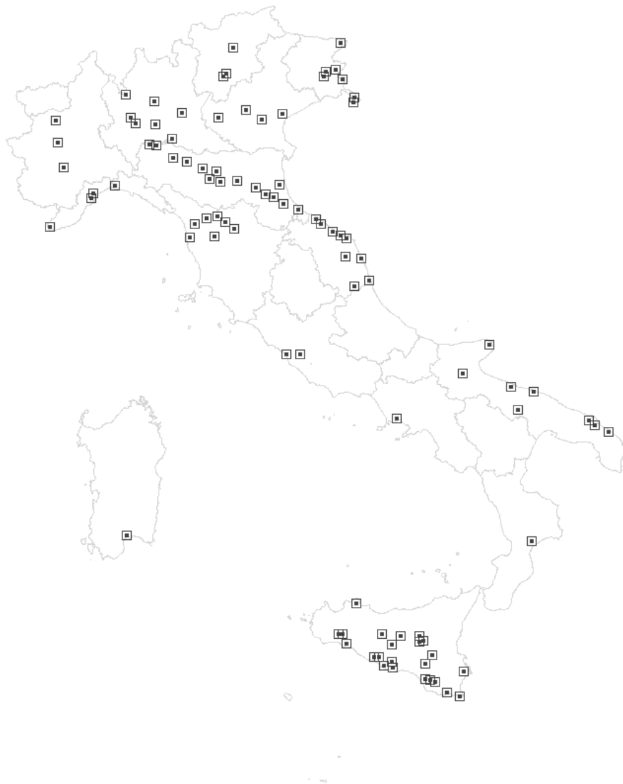
Figura 1- MSNA presi in carico nel 2008: una mappa dell'Italia. I 93 Comuni che hanno accolto l'85% dei MSNA presi in carico nel 2008